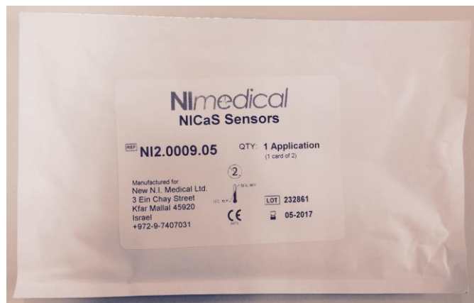
包装形態外観写真